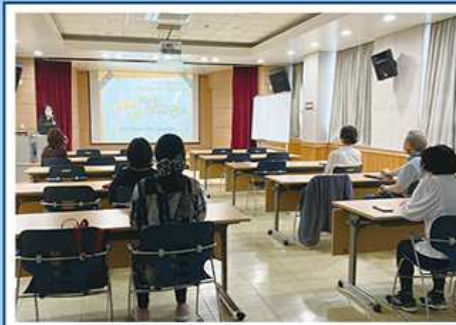
영화로 읽는 클래식